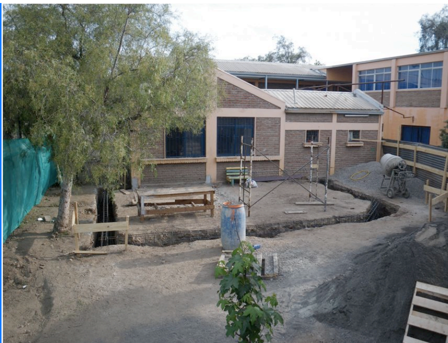
Baustelle an der Schule