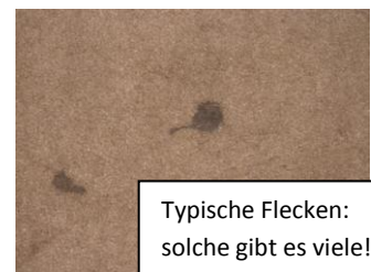
Typische Flecken: solche gibt es viele!

Nach Abzug der Zuschüsse von außen schätzen wir den von uns aufzubringenden Eigenanteil auf ca. 4.000.000 Chilenische Pesos (aktuell ca. 6.000 Euro).