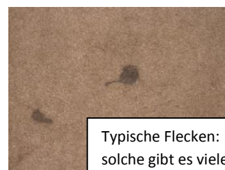
Typische Flecken: solche gibt es viele!

Auf der nächsten Seite steht, wie ein Fußbodenquadrat erworben werden kann!