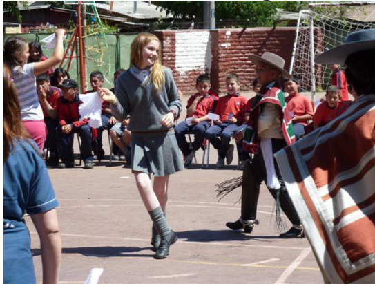
Gemeinsame "deutsch-chilenische" Cueca in Belén im Dezember 2010

Am Freitag, 16. September lädt die acción social der Deutschen Schule unsere Folkloregruppen ein, sich dort tanzend zu präsentieren und gemeinsam mit Empanadas den „18“ zu feiern. Nach vielen Besuchen der Deutschen Schule in Belén, ist das nun der erste Gegenbesuch. Deshalb freuen wir uns sehr über diese Einladung, da er ein Zeichen ist für einen echten Austausch und gegenseitige Bereicherung.