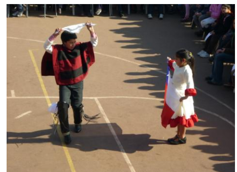
"Cueca"-Vorführung für die Schüler aus der Deutschen Schule, die als „Acción Social“ Decken und Schals in Belén verteilten.